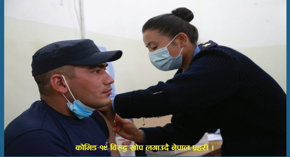
कोभिड-१९ तिरुद्दु सोप लगाउदै नेपाल प्रहरी ।