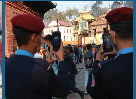
महाशिवरात्रीको अवसरमा नागरिकलाई सेवा प्रदान गर्दै नेपाल प्रहरी ।