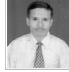
✍ अरुण खत्री 'नदी'

महेशलाई भने सफा हुन मन लाग्दैनथ्यो । उसलाई कहिलेकाहीं नुहाउन पनि अलछी लाग्थ्यो । कहिले त महिनामा एक पटक कहिले महिनामा दुई पटक सम्म नुहाउने गर्दथ्यो । धोएर राखेको लुगा लगाउन पनि महेशलाई गान्छो लाग्दथ्यो । एउटै स्कूलमा एउटै कक्षामा उनीहरू पढ्ने हुँदा प्रायजसो संगै कुराकानी गरेर स्कूल जान्थे र संगै स्कूलमा छुट्टी भएपछि घर फर्कने गर्दथे ।