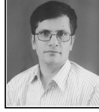
छायादत्त न्यौपाने 'बगर'

दुवैको सामु पर्ने गरी छेउमै बसे । पाकीचाहिँ अभद्र हुन्छु कि