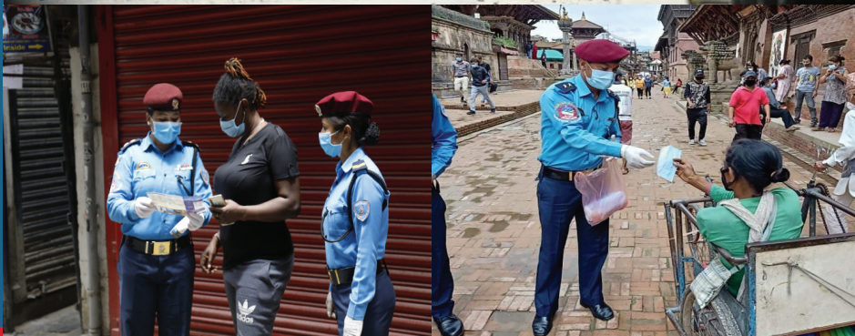
विविध स्थानमा वास्तविकलाई सेवा प्रदान गर्दै नेपाल प्रहरी ।